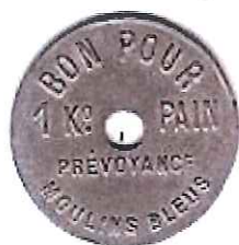
BON POUR 1kg PAIN Prévoyance Moulins Bleus (Zinc nickelé rond 30 mm percé)