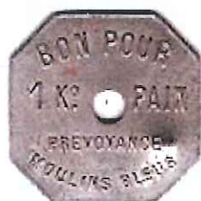
BON POUR 1kg PAIN Prévoyance Moulins Bleus (zinc nickelé Octogonal 31mm percé)