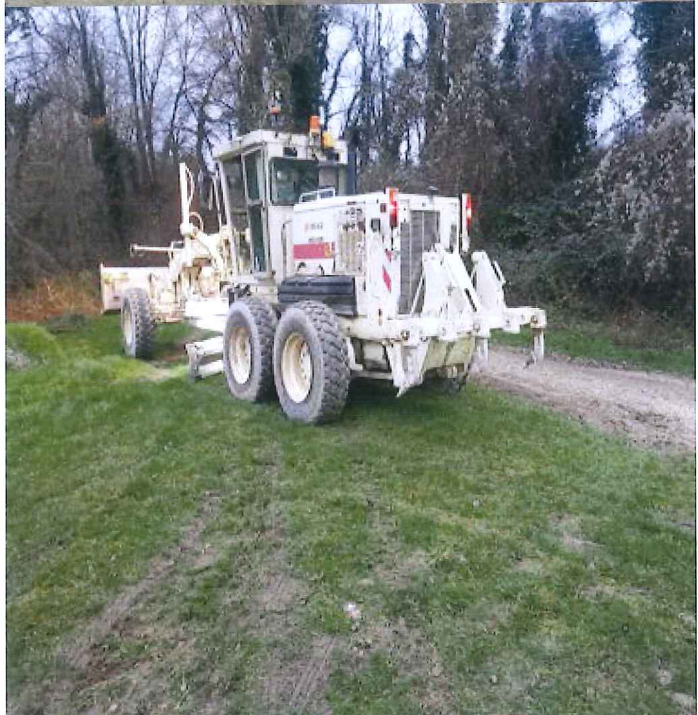
Travaux d'écoulements des eaux pluviales suite